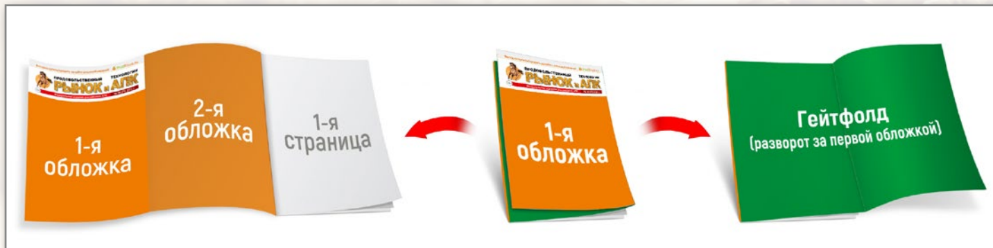
Разворот 408 x 297 мм* или два макета 208x297 мм + 200x297 мм*

*Для макетов, печатающихся на вылет без белых полей (на вылет), необходимо к размерам добавлять по 3-4 мм под обрезку с каждой стороны. Расстояние от краёв макета до значимых элементов (текст, логотипы) в этом случае – не менее 10 мм.